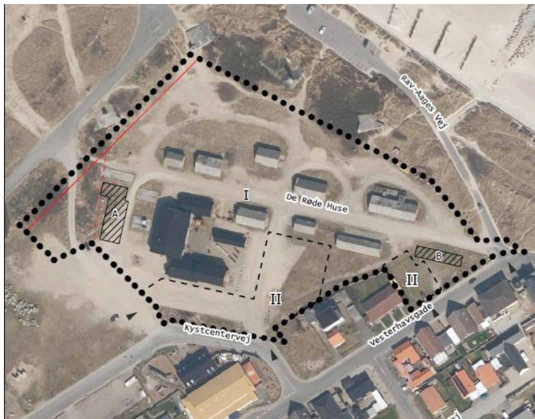
Lokalplanområdet. Delområde I - bygninger og ophold. Delområde II - parkering og ankomst.

Området med de Røde Huse i Thyborøn er omfattet af nuværende Lokalplan 183. Området var udlagt til kulturelle formål i form af udstillingsvirksomhed og undervisning og til rekreativ, offentlig anvendelse af ubebyggede arealer.