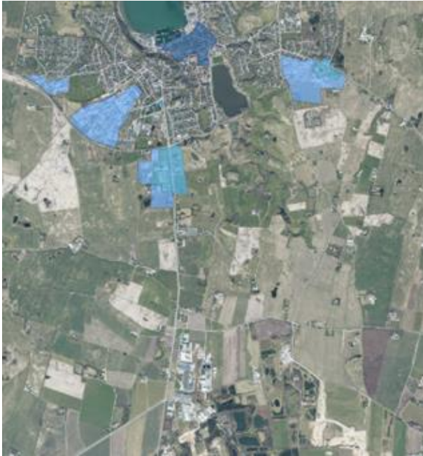
Områder der i kommuneplanen er udlagt til detailhandel

Der er udpeget afgrænsede områder i Lemvig Kommune til butiksformål. De fremgår af Lemvig Kommuneplan. For Rom erhvervsområde er der ikke udpeget arealer til udvikling af detailhandel.