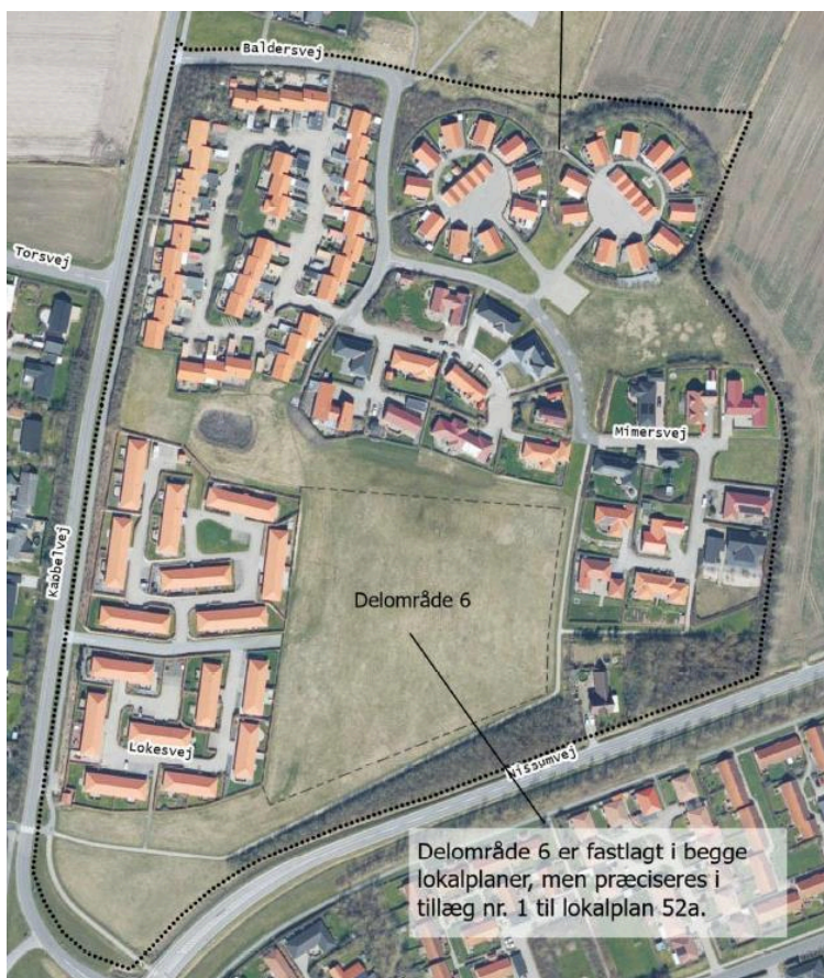
Placering af delområde 6.

Forslaget har været udsendt i offentlig høring i 8 uger fra den 22. december 2023 til den 15. februar 2024. Der er ikke indkommet indsigelser eller bemærkninger til planen.