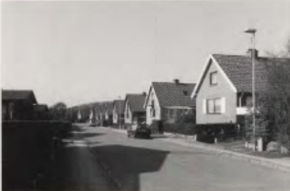
Hvis man kigger på de karakteristiske gavle langs Skrånten ses der en taktfast rytme, især fællestrekene i søforningen og materialens enheden giver bebyggelsen et harmonisk helhedsbillede.

Den ene hustype ligger langs vejens ydre side med gavle ind mod vejen, mens den anden hustype ligger på oen i midten. De karakteristiske gavlprofiler, der gentager sig i en taktfast rytme, og den enkle bebyggelsesplan er velgørende og harmonisk.