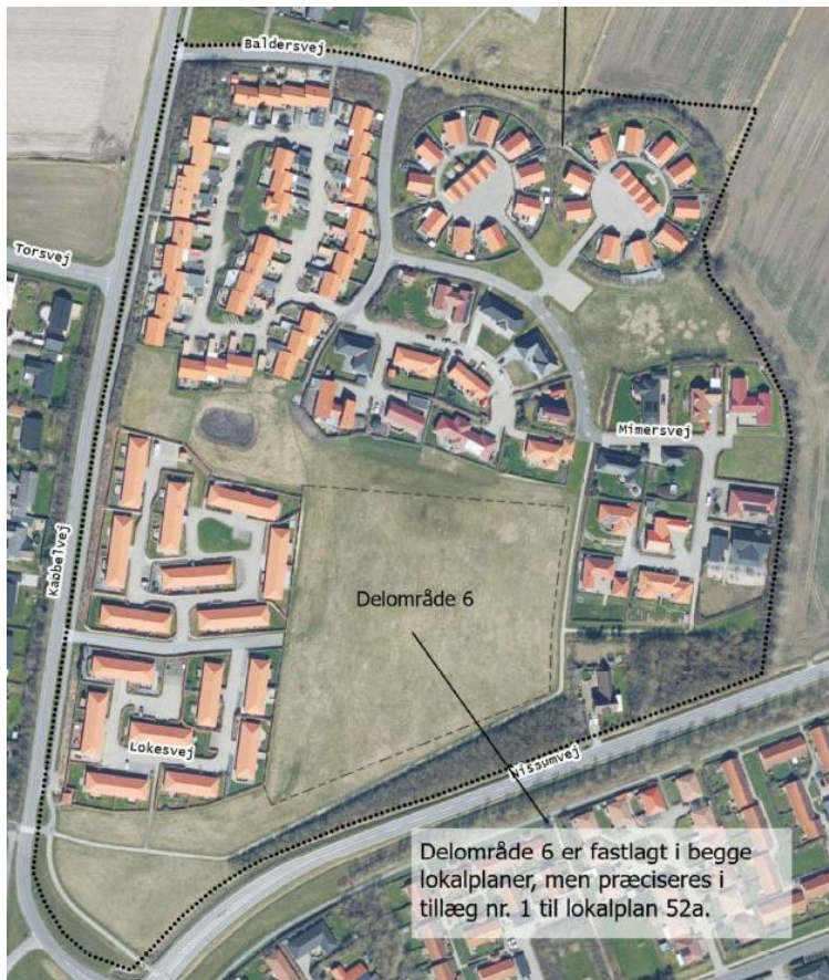
Placering af delområde 6.

Forslaget har været udsendt i offentlig høring i 8 uger fra den 22. december 2023 til den 15. februar 2024. Der er ikke indkommet indsigelser eller bemærkninger til planen.