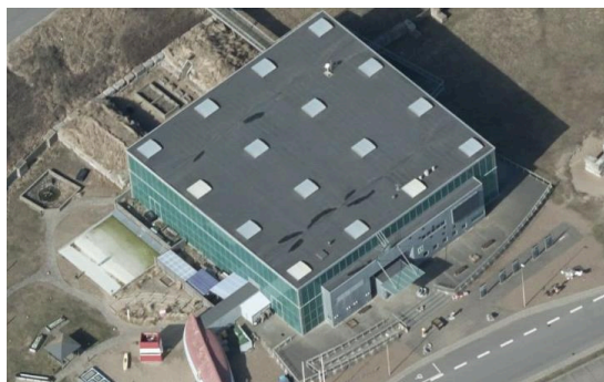
Skråfoto af Kystcenteret set fra sydøst.