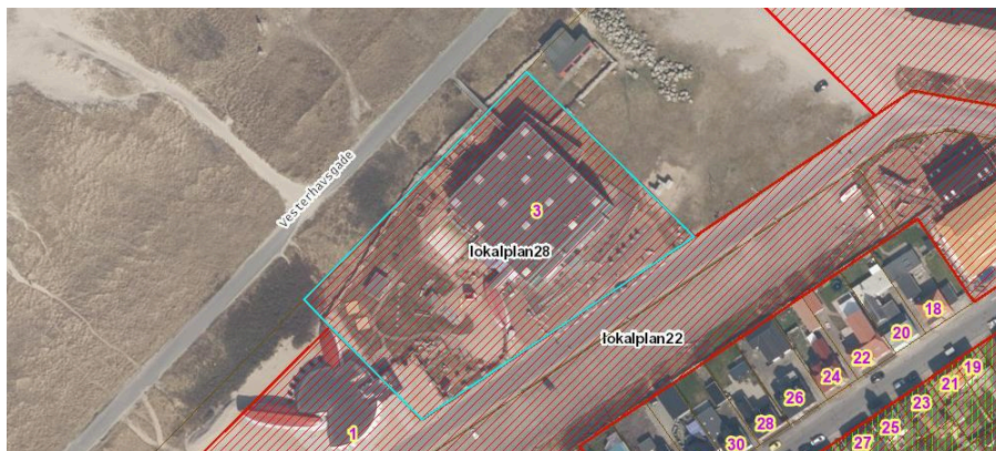
Ejendommen Kystcentervej 3 er vist på ovenstående kort med blå afgrænsning.

Det er oplyst, at der er indgået aftale om, at Kystcenteret, som i dag ejes af Fonden for Kystcenter Thyborøn, pr. 1. april 2022, overdrages til JD Real Estate ApS.