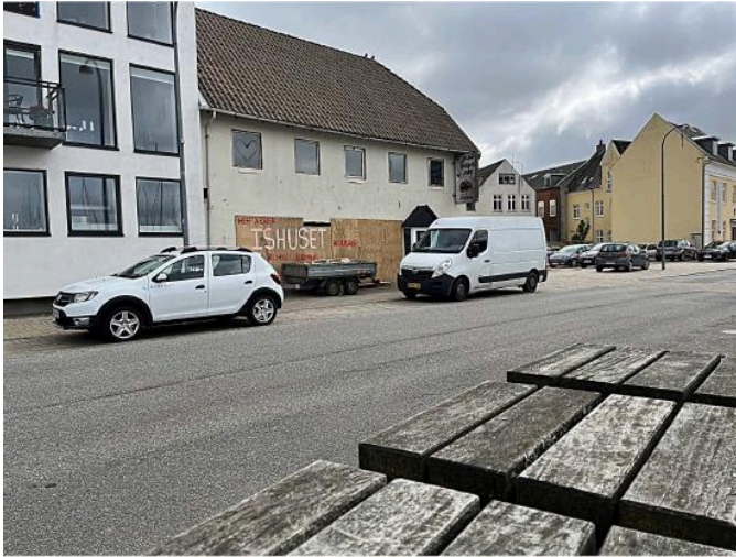
Havnegade 20 - eksisterende forhold

Ejer ønsker dispensation fra Lokalplan nr. 113 til at udføre et større, oplukkeligt vinduesparti, en ny indgangsdør og til at afblænde vinduer på 1.sal i ejendommens facade mod Havnegade. Der ønskes endvidere etableret et reklameskilt med lys over vinduespartiet.