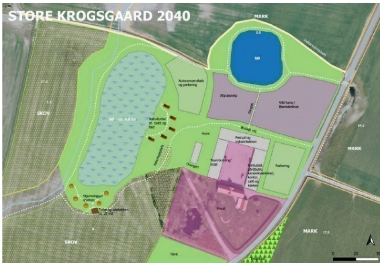
Bud på visualisering - fra projektbeskrivelsen.

Den del af ejendommens 194 ha, som ikke indgår i ny anvendelse, skal fortsat drives landbrugsmæssigt.