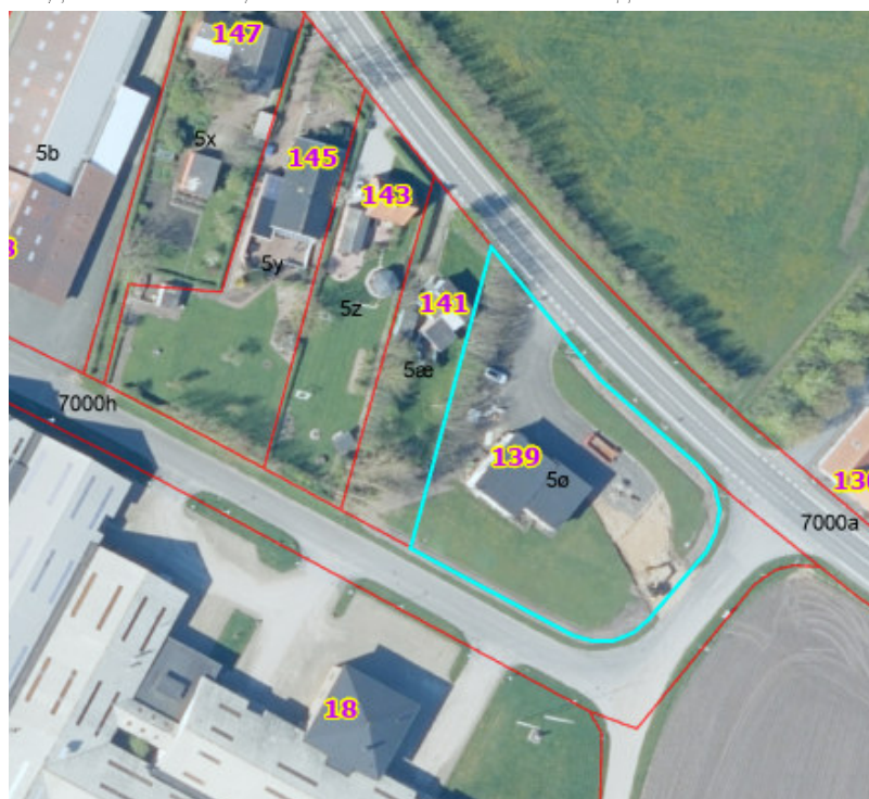
Afgrænsning gældende Lokalplan 100.