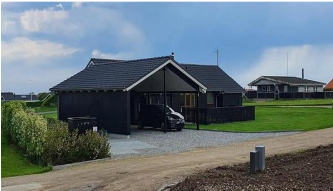
Kortbilag - Landinspektøropmålig af ny carport med mål til skel. Foto: Violvej 2 set fra sydvest, med nyopført carport og skur.

Administrationen har haft sagen i høring hos naboerne og grundejerforeningen, hvortil der er kommet indsigelser. De væsentligste bemærkninger drejer sig om udsigt og bekymring for præcedens ved at give en dispensation, efter at byggeriet er opført. Der vedlægges bilag med opsamling af de væsentligste indsigelser med administrationens bemærkninger. De indkomne indsigelser er ligeledes vedlagt som bilag.