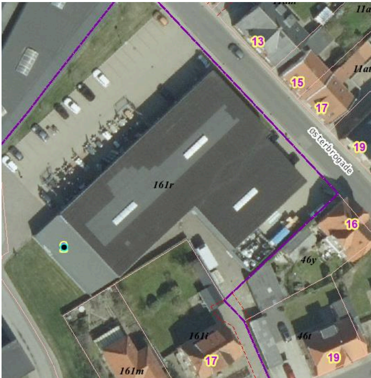
Skitse med visning af eksisterende byggeri og udvidelsen.