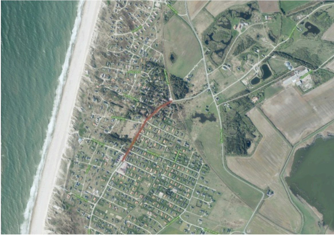
Den røde markering på kortet viser udstrækningen af projektet på Vejlbymarkeden, fra Victoria Street Station i nord til Torvet mod syd.