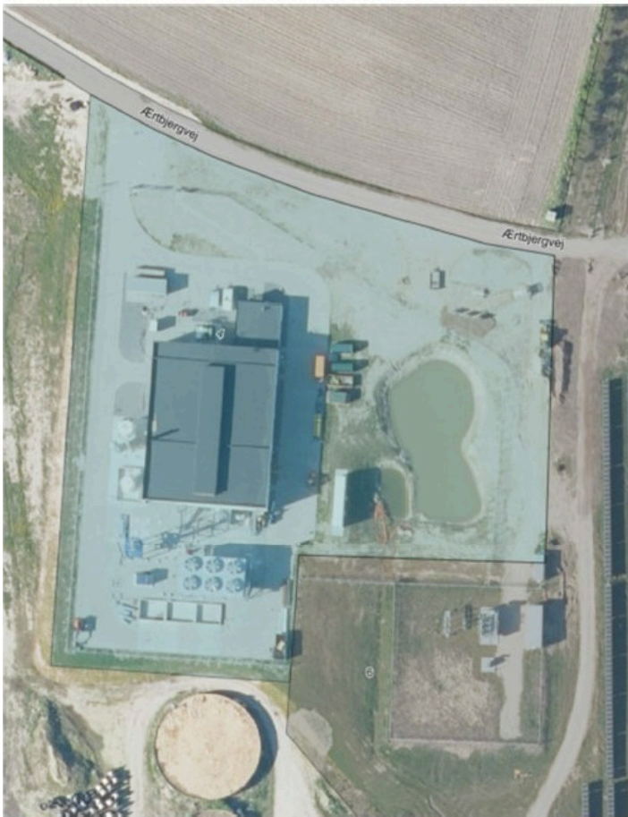
Afgrænsningen af gældende Lokalplan 217 for PtX-anlæg ved Ramme