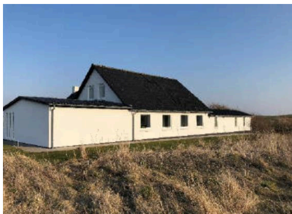
Facade uden maleri.

Der er ansøgt om tilladelse til opførelse af et maleri på del af facaden på ejendommen Juelsgårdvej 22, Ferring. Kunstneren har tidligere malet et maleri på en nyopført garage på Redningsvej 3, hvor der også er et mindre galleri.