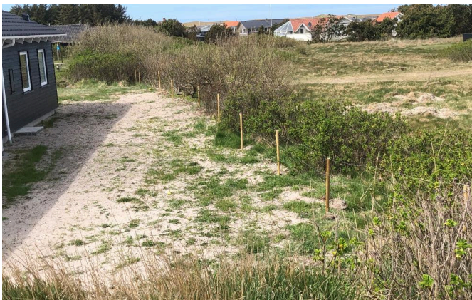
Tretrådet trådhegn langs med nordskellet

Ejer har i fremsendte ansøgning redegjort for sagen og det opsatte hegn. Ansøgningen med begrundelser er vedlagt som bilag.