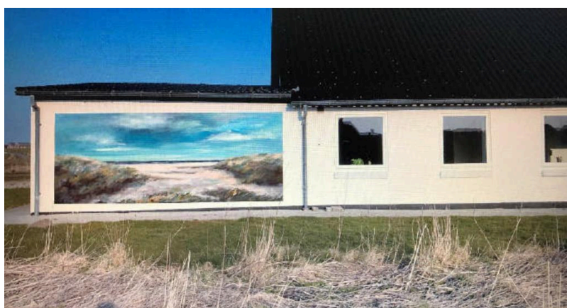
Illustration af det maleri, der ønskes malet på facaden.