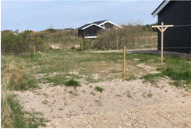
Lille jordvold med tretrådet hegn på sydsiden af grunden.