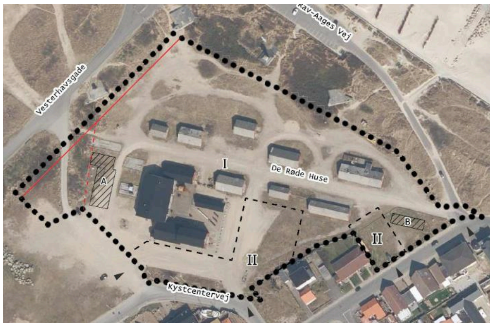
Lokalplanområdet. Delområde I - bygninger og ophold. Delområde II - parkering og ankomst.

Barakkerne og området omkring De Røde Huse repræsenterer et kulturmiljø, der på enestående vis smelter sammen med klitlandskabet og samtidig formidler forbindelsen til byen og havnen med "arbejdsgaden" ned gennem De røde Huse, som ligger i naturlig forlængelse af Havnegade. Barakkerne er en vigtig del af byens historie og fortæller om kystsikring. Barakkerne er med deres stærke, velbevarede karakter af industrielt kulturmiljø og bebyggelsesstruktur med til at kendetegne det særlige ved Thyborøn.