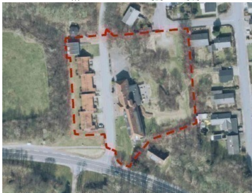
Lokalplanområdet fra lokalplanen kortbilag 2. lokalplanafgrænsningen.